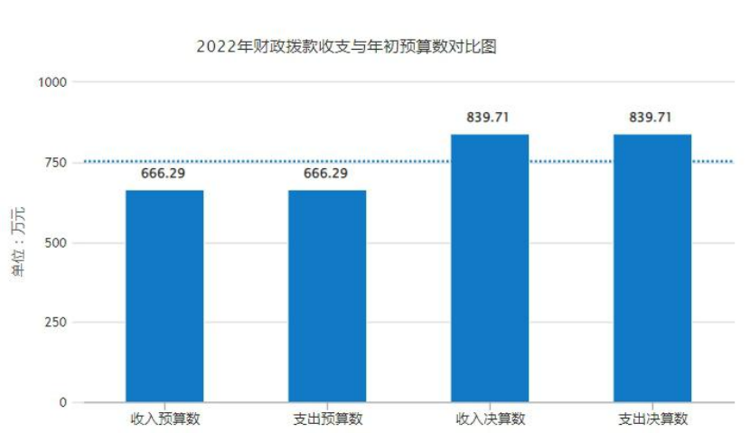
2022 年财政拨款收支与年初预算数对比图（图 4）

3. 国有资本经营预算财政拨款本年收入 0 万元，与年初预算持平，支出 0 万元，与年初预算持平，主要是我单位无国有资本经营预算财政拨款。