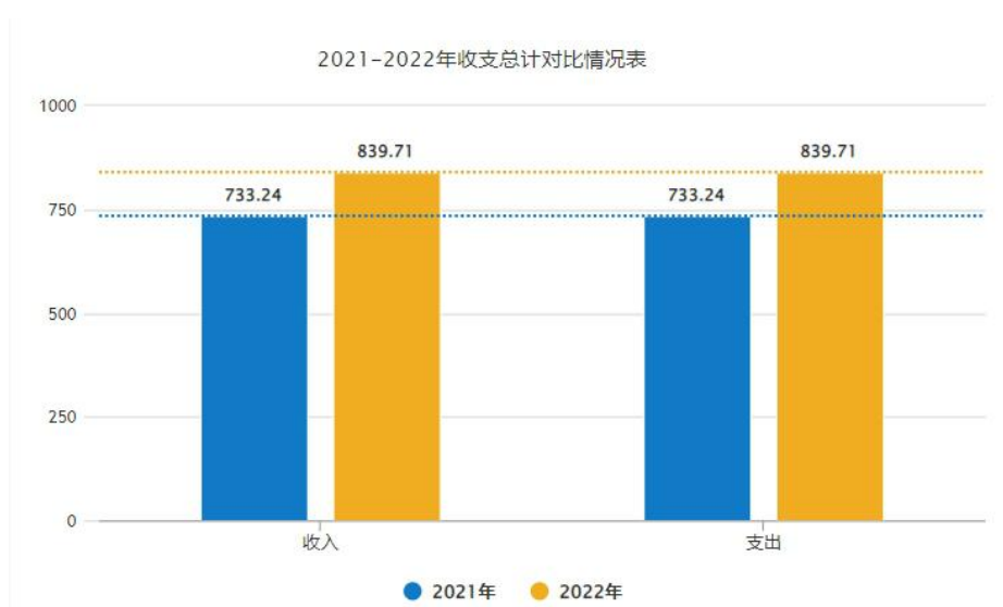
2021-2022 年收支总计对比情况表（图 3）

3. 国有资本经营预算财政拨款本年收入 0 万元，与上年决算持平，支出 0 万元，与上年决算持平，主要是我单位无国有资本经营预算财政拨款。