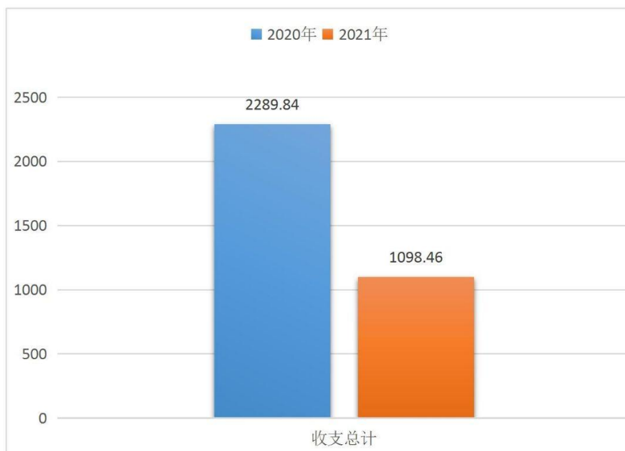
图 1：2020-2021 年收支决算对比情况

本部门 2021 年度收、支总计（含结转和结余）1098.46 万元。与2020年度决算相比，收支各减少1191.38万元，降低52.0%，主要原因是项目有所减少。