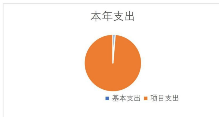
图 1：支出构成情况（按支出性质）

本部门2019年度本年支出合计2453.15万元，其中：基本支出31.43万元,占1.30%；项目支出2421.72万元，占 98.70%；。如图所示：