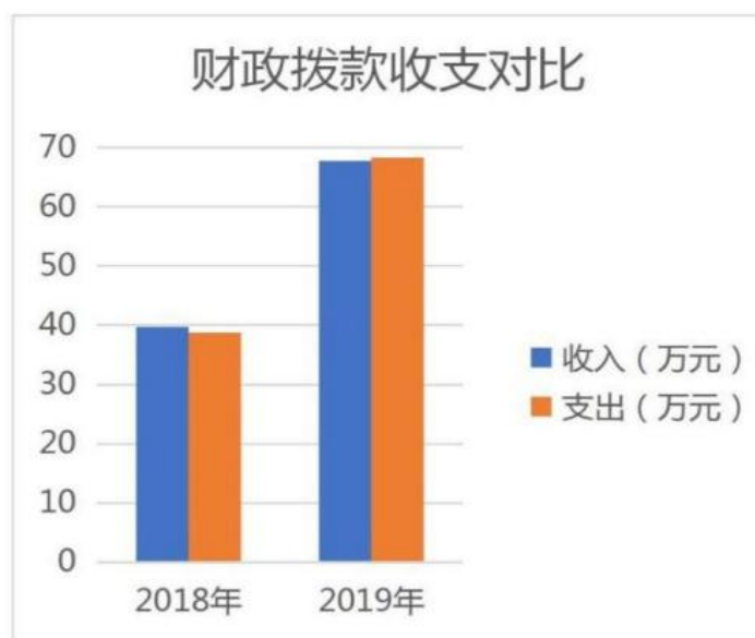
图 2：财政拨款收入支出决算

本部门 2019 年度财政拨款本年收入 67.75 万元，比 2018 年度增加 28.03 万元，增长 70.57%，主要原因是拨付去世人员抚恤金及项目支出有所增加。本年支出 68.29 万元，比 2018 年度增加 29.57 万元，增长 76.37%，主要原因是拨付去世人员抚恤金及项目支出有所增加。