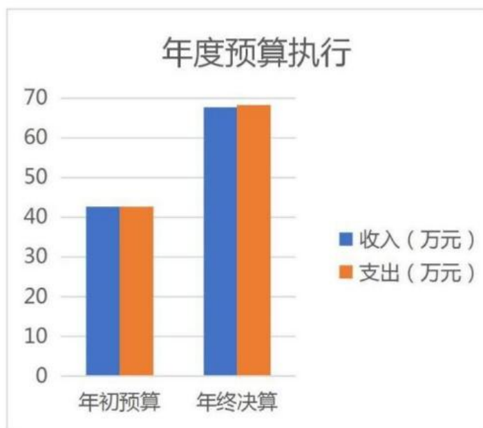
图 3：财政拨款收支与年初预算数对比